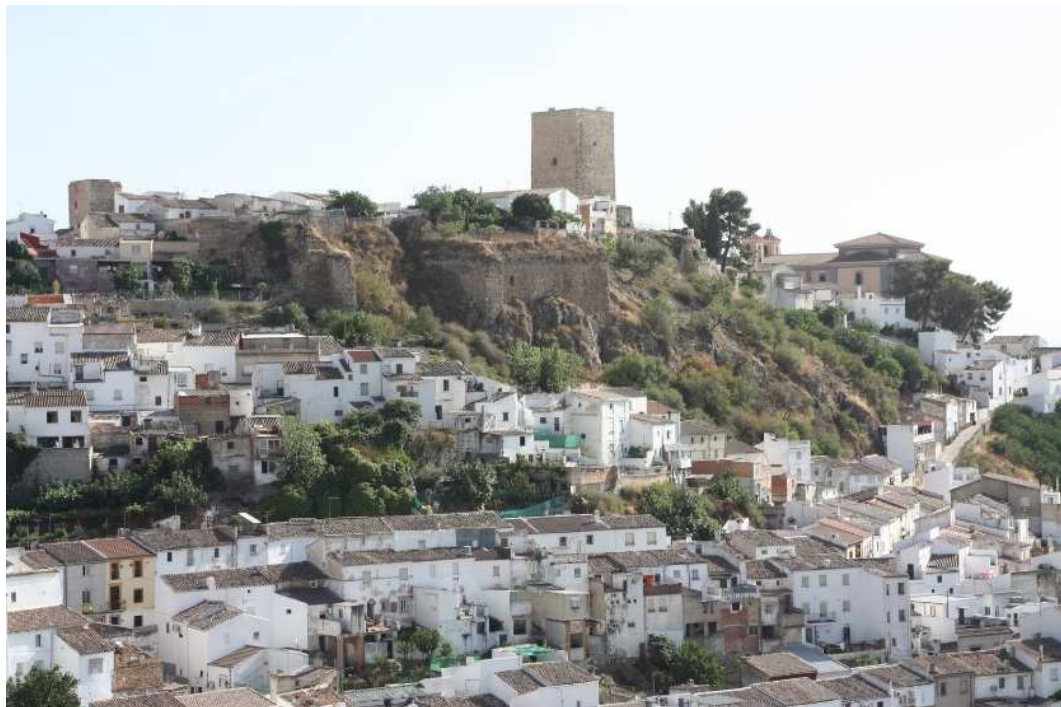
(Panorámica de la ciudad en la que aparecen las antiguas murallas del casco histórico)

Edificios emblemáticos como la casa de la juventud, o la antigua estación de Renfe, o las Murallas y Torres que configuraban Martos como antigua fortaleza medieval, así como la creación de nuevas estrategias de desarrollo turístico , mediante la creación de espacios de interpretación de la cultura del aceite, o el desarrollo de políticas de acción comercial y “ venta ” de la ciudad a nivel turístico, se hacen necesarias para dar continuidad a esta reciente apuesta de convertir a Martos en referente