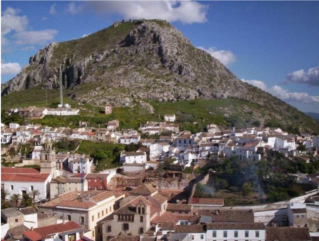
(Panorámica de la ciudad focalizando parte del casco histórico)