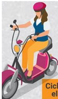
Vehículos para personas con diversidad funcional